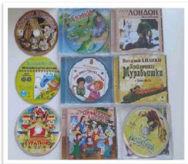
Аудиальная среда, доступная воспитанникам, адаптируется с учетом потребностей, ожиданий, инициативы заинтересованных сторон