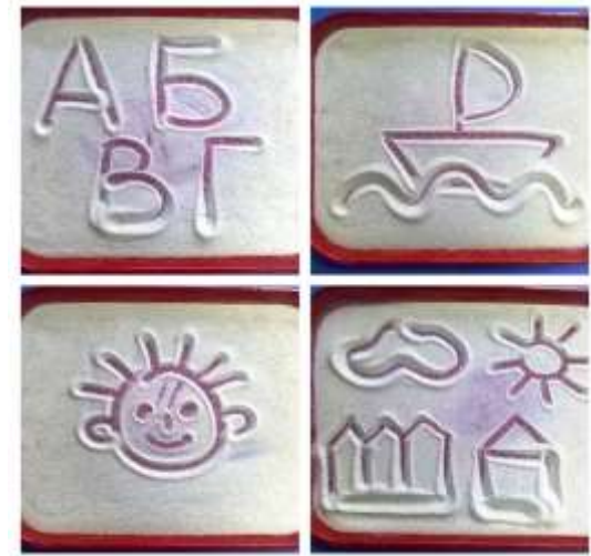
Педагог читает и пишет в присутствии детей, побуждает детей распознавать буквы и надписи.