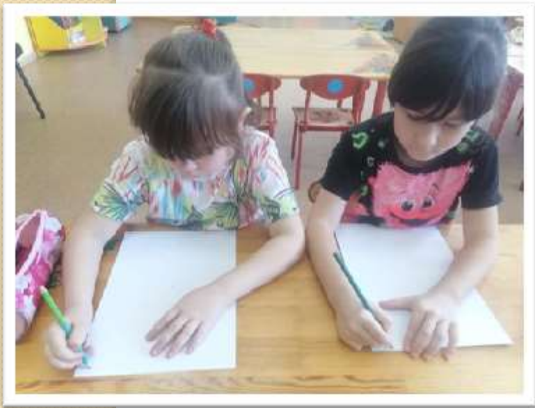
« Дописывание недостающих элементов у букв»