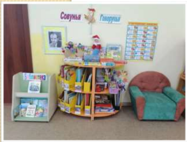
Организовано развитие неречевого и речевого слуха детей.