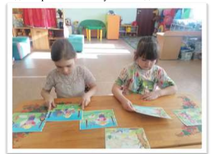
Детей учат рассказывать истории или случаи из жизни в правильной последовательности событий.