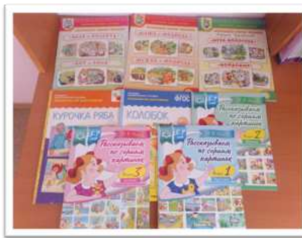
Материалы, которые используются для развития слуха детей, подобранных с учетом социокультурного контекста развития