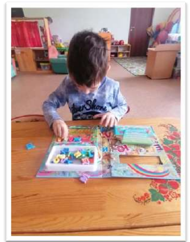
« Выкладывание слова из магнитной азбуки»