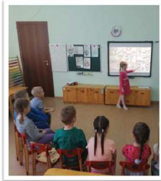
Педагог помогает детям находить связь между текстами (историями) и собственным опытом.