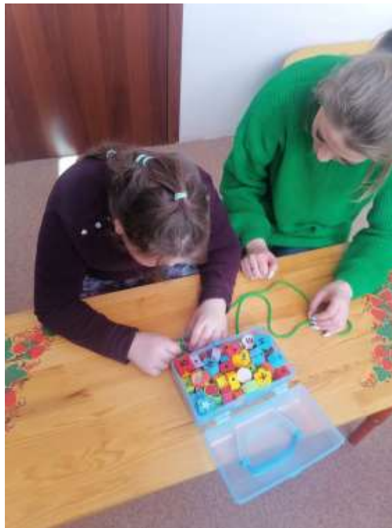
« Выкладывание слов из букв на ниточке»