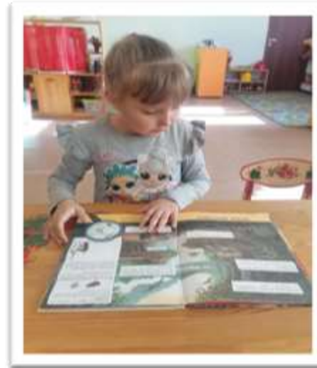
Педагог обращает внимание детей на различные записи о животных.