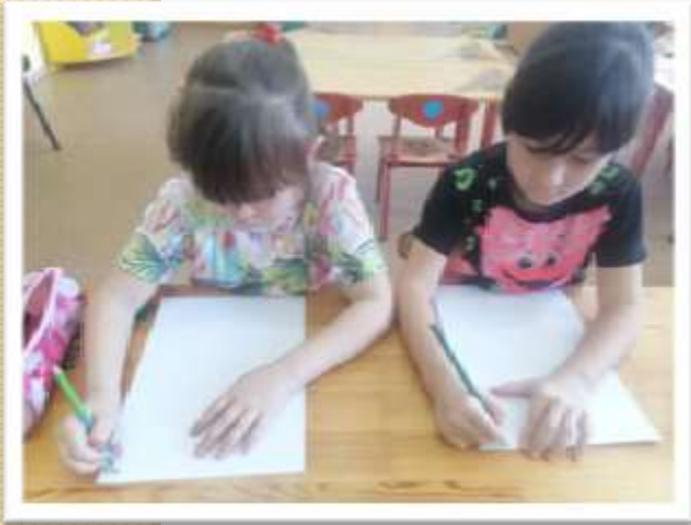
Педагог поощряет воспитанника делать подписи и короткие записи.