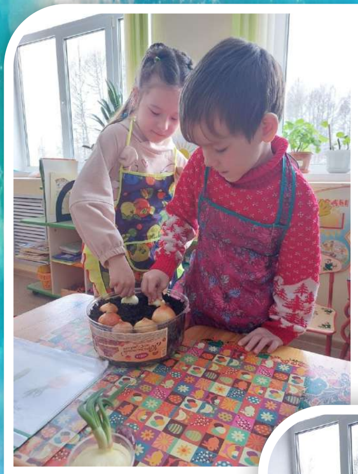
Посадка лука И наблюдение