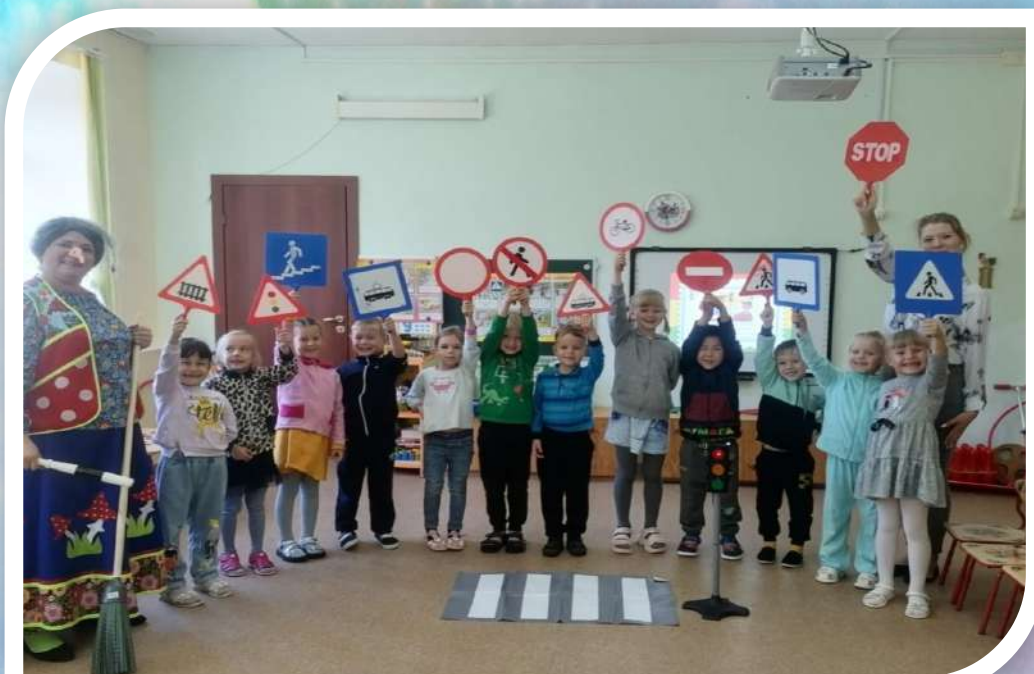
Развлечение по ППД «Приключения бабы Яги на улицах города»