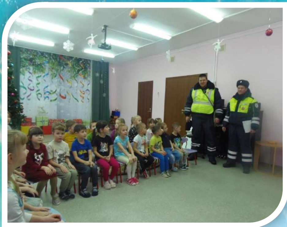
Встреча с инспекторами ГИБДД о правилах безопасности на дороге