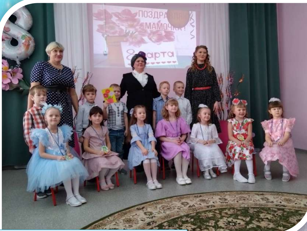
Праздник 8 марта «Мисс красоты»