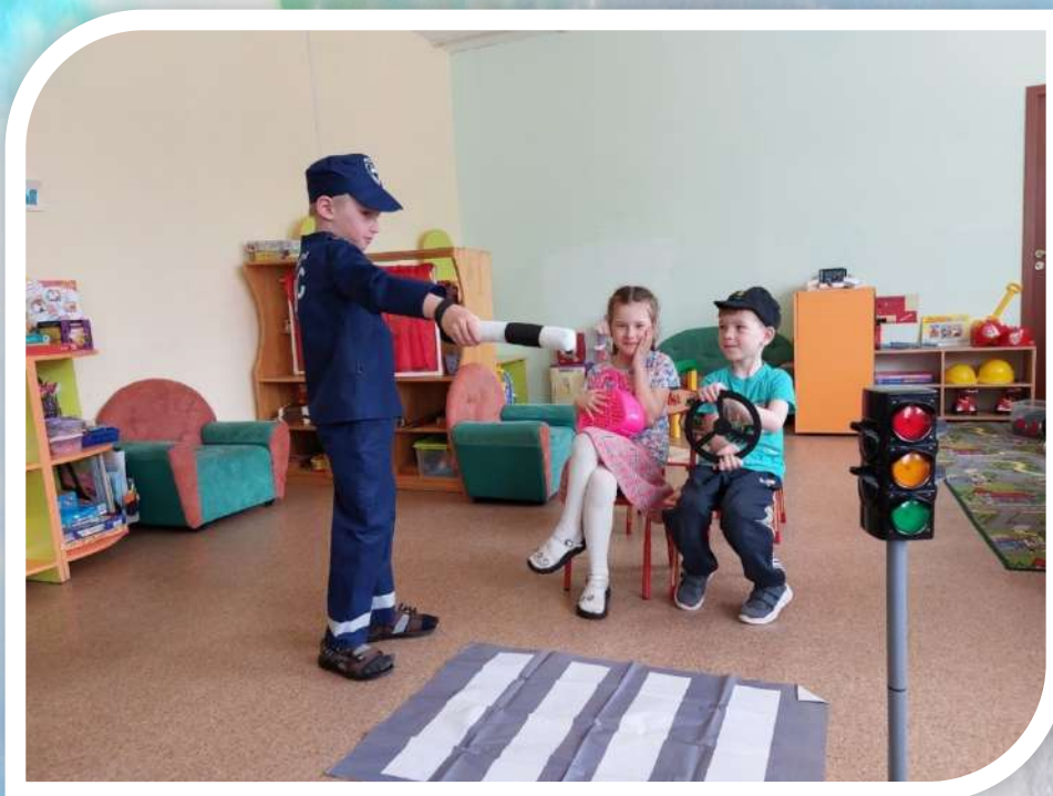
Правила дорожного движения «Нарушать нельзя»