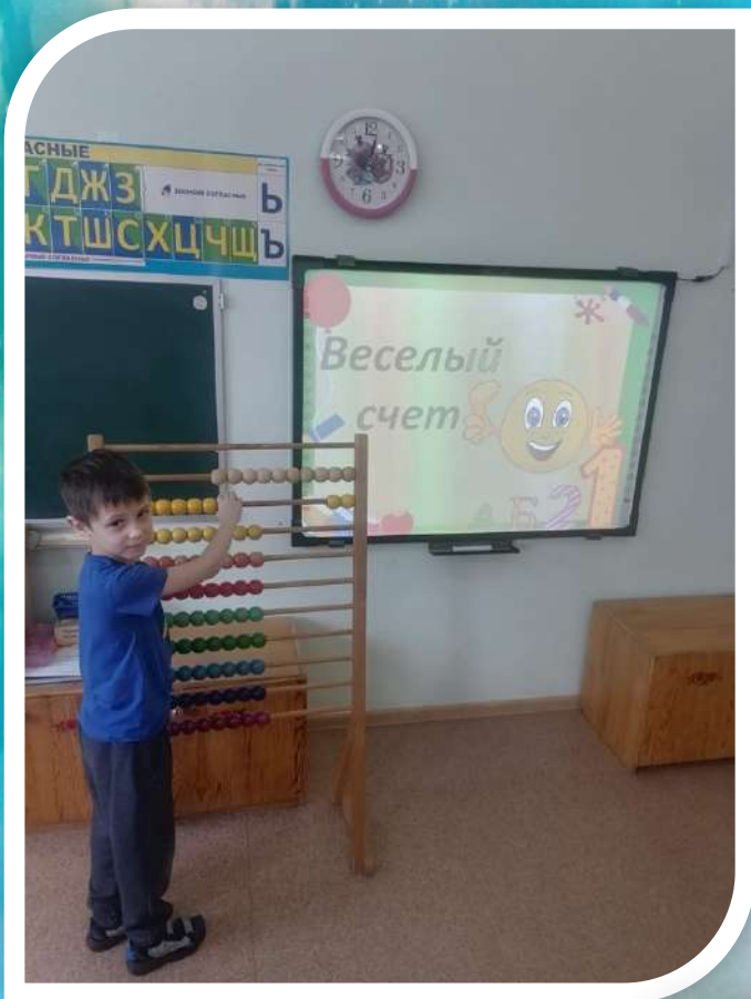
Считаем на счетах «Веселый счет»