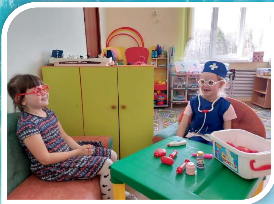
На приеме у врача