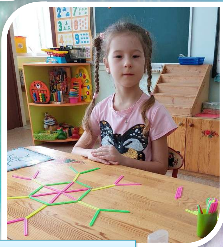
Считаем на счетных палочках и составляем узор