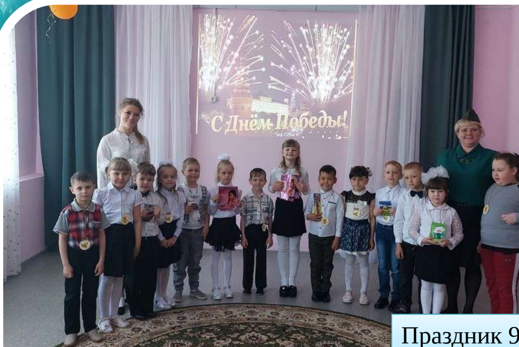
Праздник 9 мая